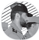
شهید عباس بابایی، یک جوان حزب‌اللهی و فرمانده پایگاه هشتم شکاری اصفهان

را نقل کرد. خلبانی بود که رفت در بمباران مراکز بغداد شرکت کرد، بعد هم شهید شد. او جزو همان خلبان‌هایی بود که از اول با نظام ناسازگاری داشت. شهید عباس بابایی با او گرم گرفت و محبت کرد؛ حتی یک شب او را با خود به مراسم دعای کمیل برده بود؛ با این که نسبت به خودش ارشد هم بود. در میان نظامی‌ها این چیزها خیلی مهم است. یک روز ارشدت تأثیر دارد؛ اما او قلباً و روحاً تسلیم بابایی شده بود. شهید بابایی می‌گفت دیدم در دعای کمیل شانسانه‌هایش از گریه می‌لرزد و اشک می‌ریزد. بعد رو کرد به من و گفت: عباس! دعا کن من شهید بشوم! این را بابایی پس از شهادت آن خلبان به من گفت و گریه کرد. ● ۸۳/۱۰/۲۳