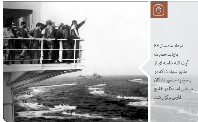
مرداد ماه سال ۶۶ بازدید حضرت آیت‌الله خامنه‌ای از مانور شهادت که در پاسخ به حضور ناوگان دریایی آمریکا در خلیج فارس برگزار شد.

○ ج) با توجه به مردمی بودن سیستم تکثیر و توزیع نشریه، می‌توانید از ظرفیت کمک‌های مردمی در این رابطه استفاده کنید. انشاءالله از این شماره، نسخه ویژه‌ای نصب در تابلوی اعلانات نشریه نیز برای صرفه جویی در هزینه‌ها در سایت قرار خواهد گرفت. پیشنهاد می‌شود در صورت تکثیر نشریه تأکید شود پس از مطالعه در اختیار سایر افراد قرار گیرد. ●