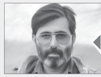
این شماره تقدیم می‌شود به روح پرفروش شهید سیدمرتضی آوینی

«گاهی حرفی را کسی می‌زند و حرف بزرگی است؛ اما بی‌دست که خودش اعتقادی به این حرف ندارد. اما این صدا (صدای شهید آوینی در برنامه روایت فتح) آن صدایی است که بزرگترین حرف‌ها را می‌زند و خودش اعتقاد داشت. مثلاً می‌گفت: «این جوانان ما، به راه‌های آسمان آشناوند تا به راه‌های زمین.» این را چنان می‌گفت که گویا راه‌های آسمان را خودش رفته، دیده و می‌داند که این‌ها شناخته‌اند! ۷۲/۶/۱۱»