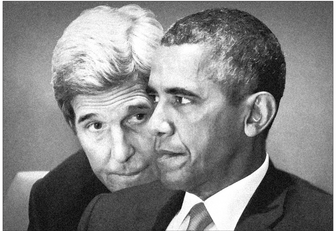
ایران هراسی، یکی از ۳ ابزار دشمن از دیدگاه رهبر معظم انقلاب

پس از دوران آیتا... حائری، با تلاش افرادی چون امام خمینی، آیتا... بروجردی زعامت حوزه قم را بر عهده گرفت که بر شور و نشاط علمی حوزه دوچندان اضافه کرد. او با ارائه شیوه‌ی جدیدی از تدریس مباحث فقهی، نسلی از شاگردان را تربیت کرد که بعدتر جزو مراجع و اساتید مهم حوزه شدند. آیتا... بروجردی همچنین در زمینه‌ی موضوعات سیاسی - اجتماعی نیز اقداماتی انجام داد که می‌توان به مسائلی چون پیشنهاد گنجاندن درس تعلیمات دینی در کتب درسی مدارس و موافقت دولت با آن، پیشنهاد توقف قطارها در ایستگاه برای اقامه‌ی نماز مسافران، مقابله با نفوذ بهائیت در مراکز دولتی، حمایت از مردم فلسطین و صدور اعلامیه درباره‌ی آن اشاره کرد. پس از ارتحال آیتا... بروجردی، بسیاری از شاگردان او، گرداگرد امام شدند به طوری که در درس خارج او، بیش از ۴۰۰ تن شرکت می‌کردند. در این دوران بود که امام خمینی، با علم به تثبیت جایگاه و (۳)